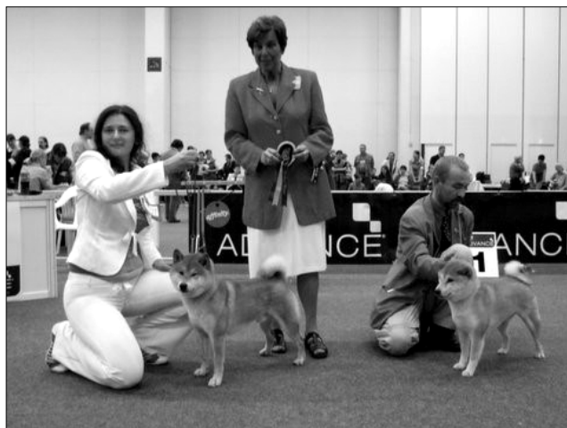
BOB & BOS