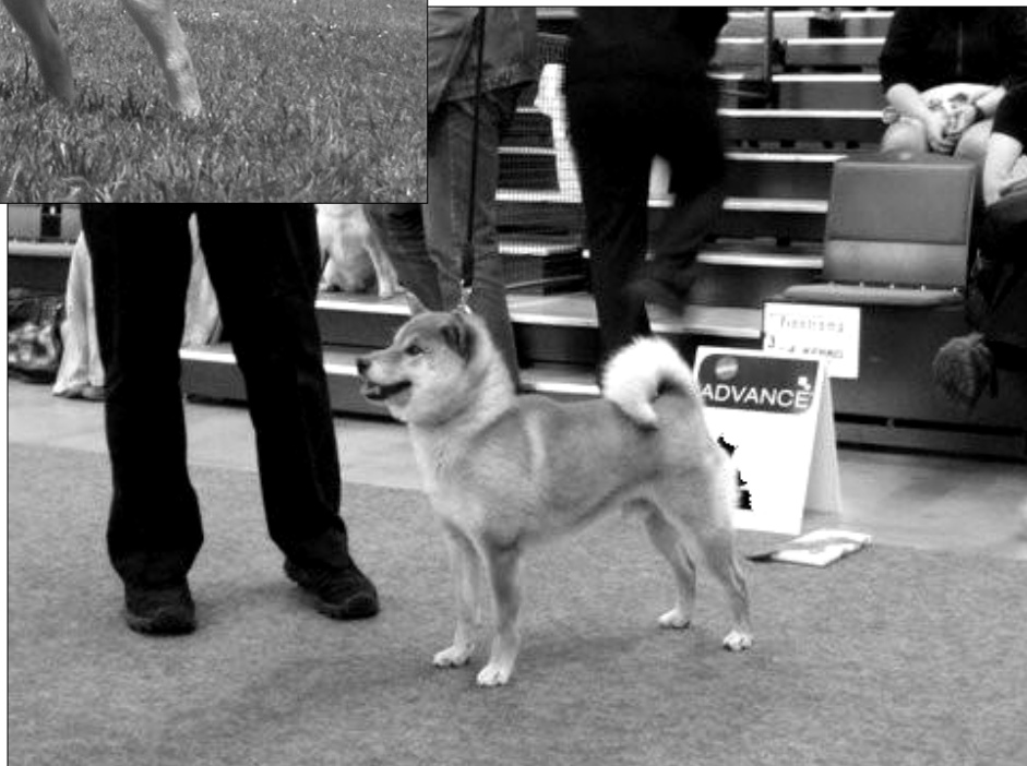
MUSASHI GO SOUSHU CHOUOUSHOU